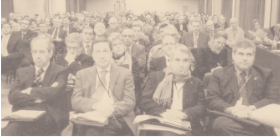
Panoramica del 37° Congresso Nazionale Sna