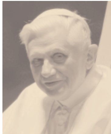
Papa Joseph Ratzinger

Il 19 aprile eletto Papa il cardinale Joseph Ratzinger col nome di Benedetto XVI.