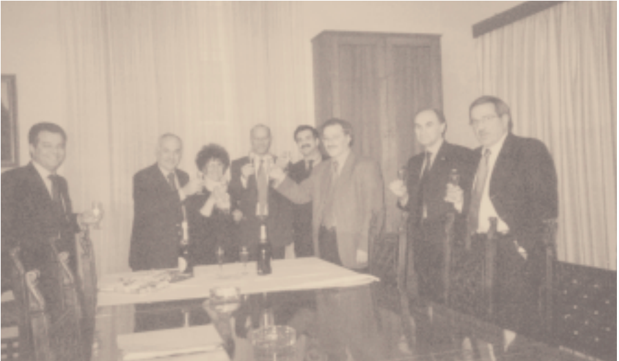
Roma, foto di gruppo dei firmatari dell'accordo Ana 2003