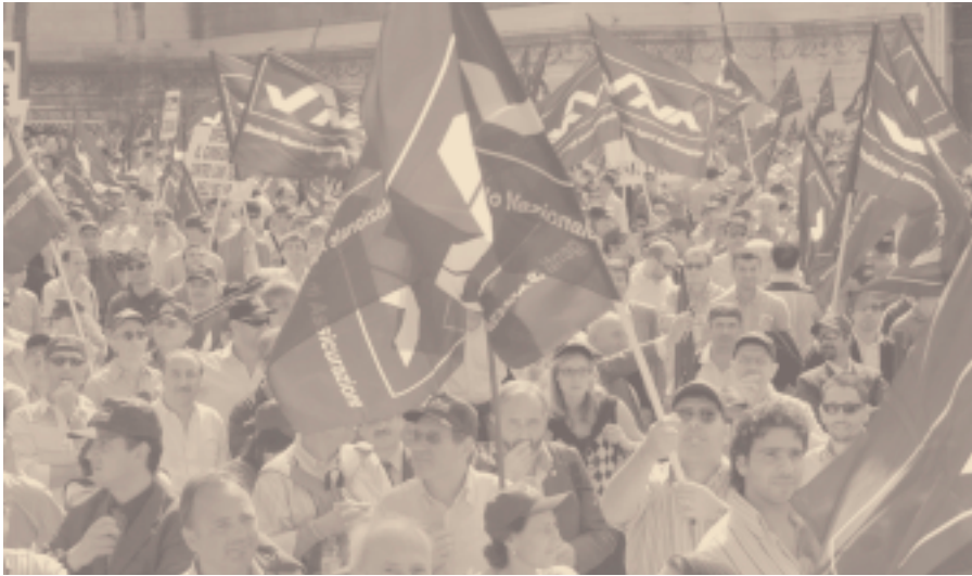
Manifestazione nazionale degli agenti di assicurazione contro le decisioni dell'Isvap, Roma 28 settembre 2006