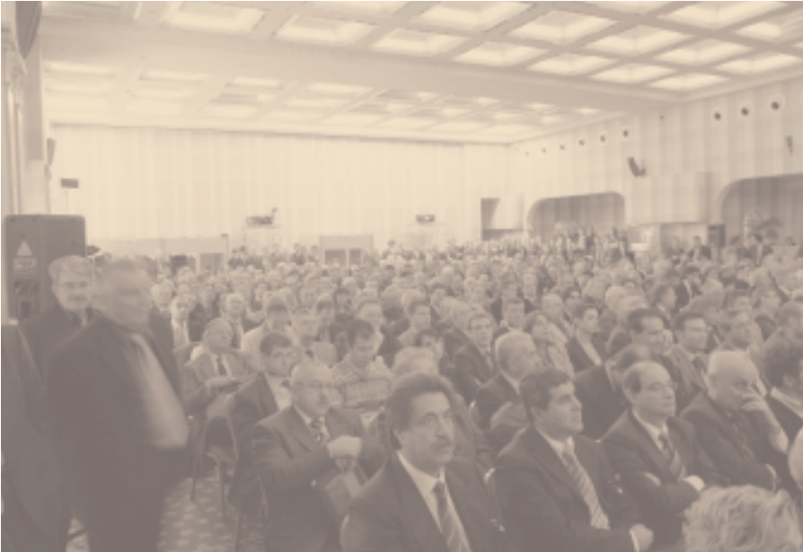
Partecipanti al Convegno di Roma

dell'azienda. Conta molto potere scegliere. Nell' Europa del nord, per esempio, i brokers sono in maggioranza, mentre al sud prevalgono gli agenti generali. I politici non inventano nulla di nuovo, ma interpretano il cittadino. L'importante è non soffermarsi su posizioni di principio. L'illustre ospite ha tenuto a recare il saluto del presidente del Bipar, David Harari, riportato pure nella brochure delle relazioni.