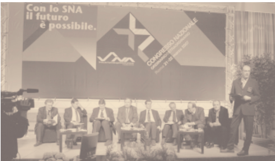
Con la Sna il futuro è possibile - Roma 21 marzo 2007

Atmosfera era gelida fuori, nonostante il primo giorno di primavera, ed infiammata all'interno del salone di rappre-